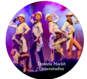
Daniela Mackh Dancestudios