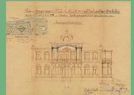
Bauplan Villa Gallia, 1899 (Stadtarchiv Baden)