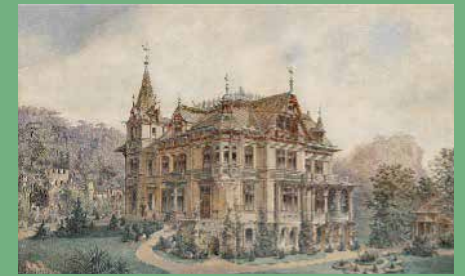
Villa Gutmann, um 1900