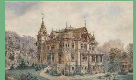
Villa Gutmann, um 1900