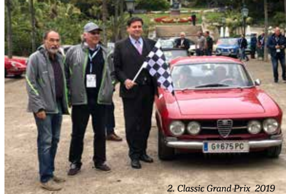
2. Classic Grand Prix 2019