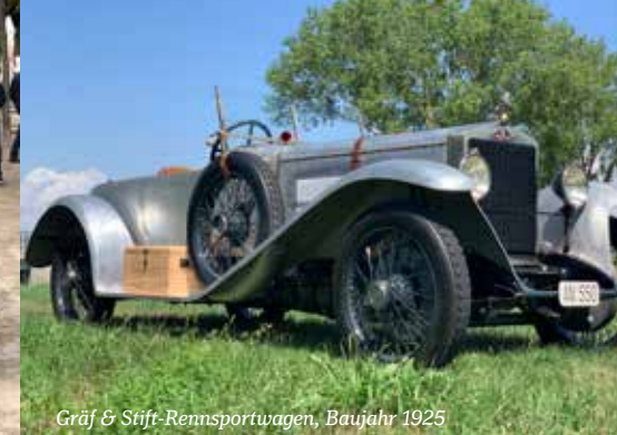
Gräf & Stift-Rennsportwagen, Baujahr 1925