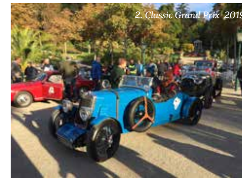
2. Classic Grand Prix 2019

Mit dem gesamten Erlös der Rallye unterstützt der Lions Club Baden Helenental in Not geratene Menschen im Raum Baden.