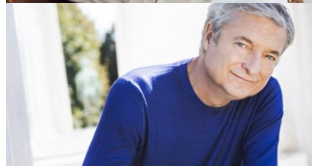
Alfred Dorfer