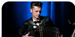
Herbert Pixner © Wriphoto

Informationen & Tickets: www.stadt-kultur.at Ticketauskunft (keine Reservierung) unter 0660 / 11 289 02