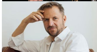
Philipp Hochmair