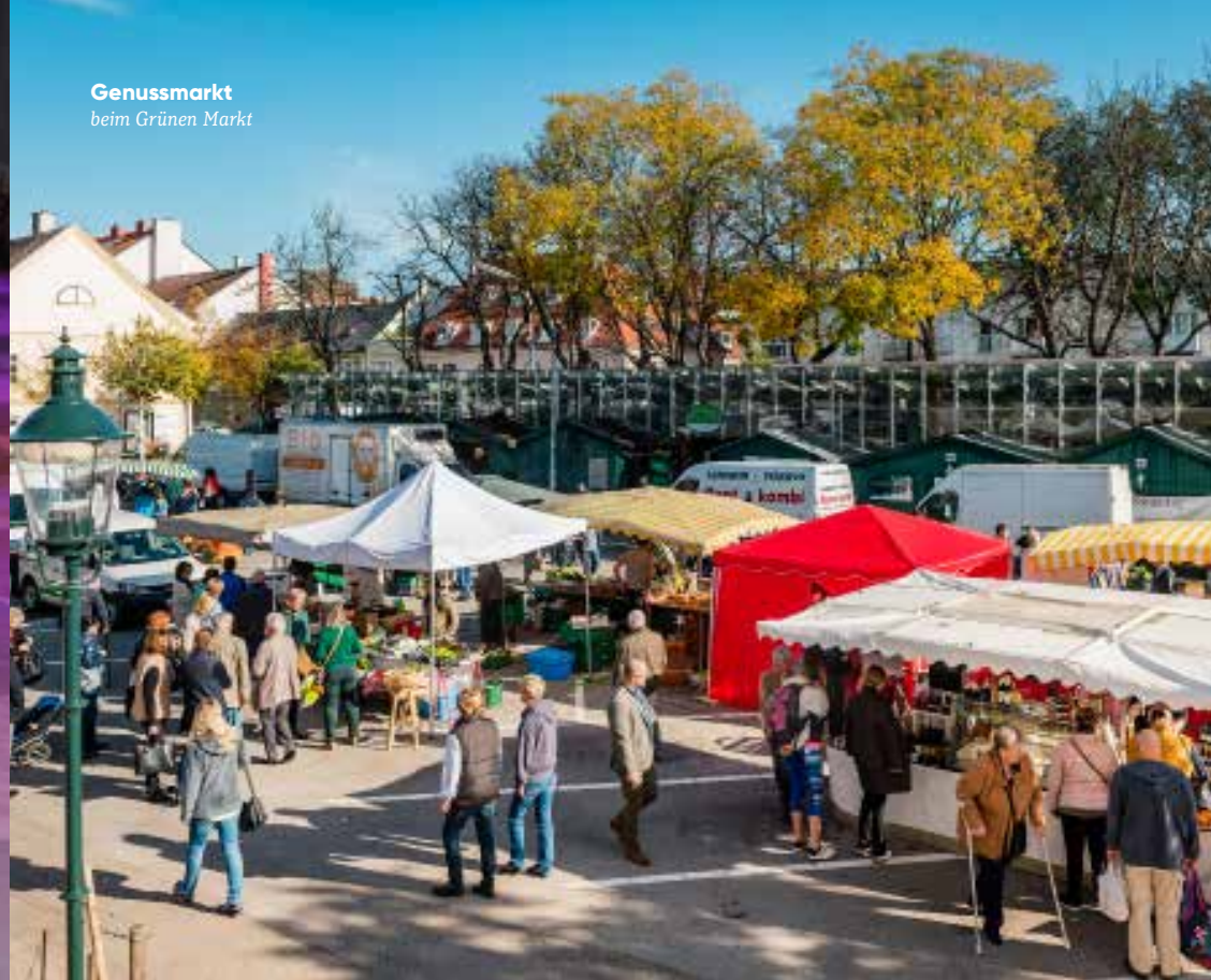
Genussmarkt beim Grünen Markt

(nur paarweise) unter www.city-dancing.at